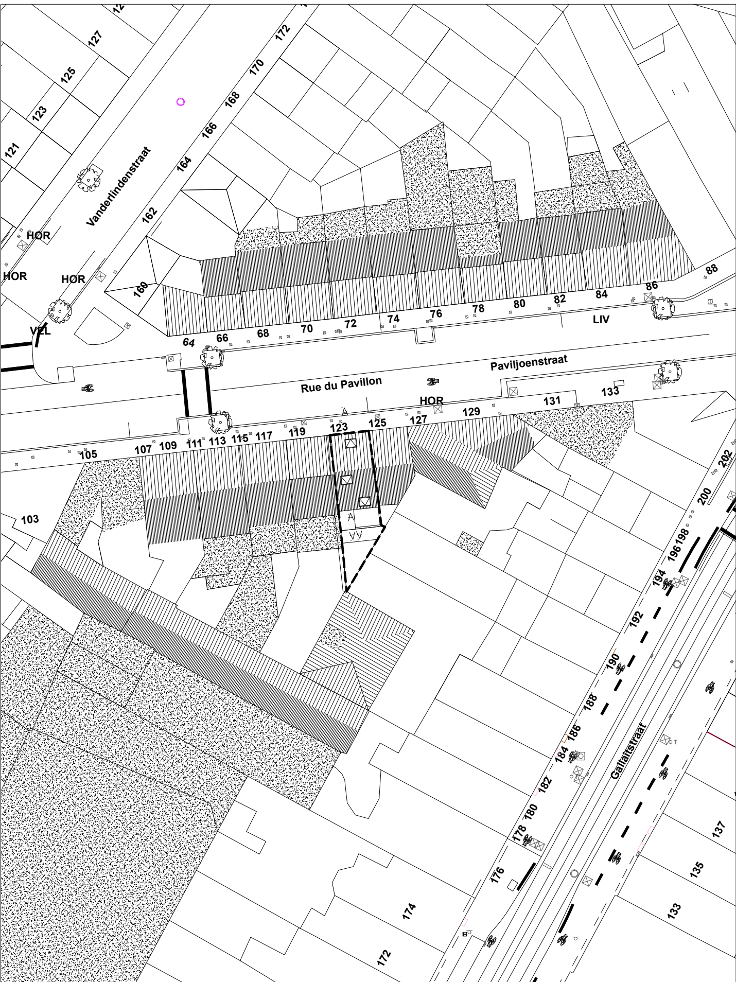
plan d'implantation - éch. 1/500e